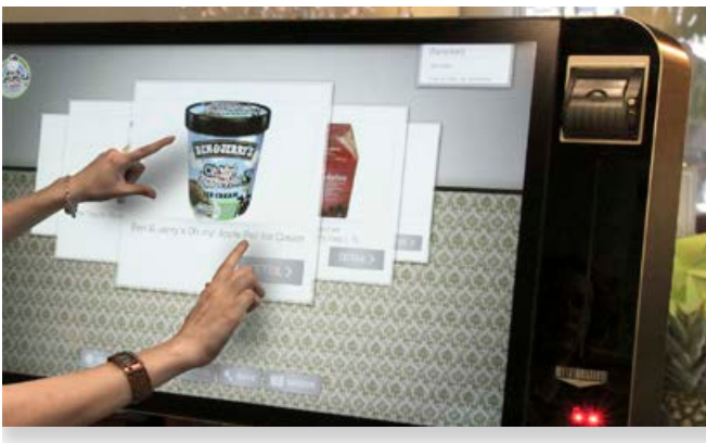
OXID eShop POS bei „Emmas Enkel“ im Einsatz

Die Benutzeroberfläche von OXID eShop POS ist optimal an den großen Touchscreen-Bildschirm angepasst: Hohe Auflösung und brillante Farben. Dabei ist weniger mehr: Mit der einfachen und intuitiven Navigation kommen auch ungeübte Kunden sofort klar.