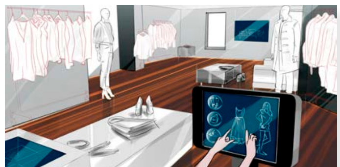
Darstellungsbeispiel Showroom mit OXID eShop POS

Die möglichen Einsatzszenarien sind breit gefächert. Über wenige Touch-Klicks oder alternativ Barcode- / RFID-Scan rufen Ihre Kunden Artikel online auf. Dank Live-Anbindung wird Ihr geballtes Know-how nun auch am Point of Sale verfügbar. Lassen Sie Ihre Kunden im virtuellen Dressroom die schönsten Styles kombinieren, im virtuellen Kamera-Spiegel begutachten und mit ihren Freundinnen auf Facebook teilen. Ersparen Sie Ihren Kunden das „Tütenschleppen“ und bieten Sie den einfachen Versand nach Hause an, auch von Artikeln, die aktuell nicht in der Filiale verfügbar sind. Wickeln Sie Ihre Retouren effizient ab oder lassen Sie sich von Kunden Arbeit abnehmen: Selbst das sichere Bezahlen über OXID eShop POS wird so einfach und bequem wie am Bankautomaten um die Ecke. Ihrer Strategie und Fantasie sind keine Grenzen gesetzt.